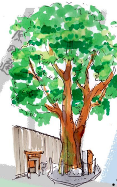
源氏の光源氏のモデルとされる嵯峨天皇の皇子源融の邸宅「河原院」の跡があり、この榎の大樹は、この邸内にあった籬(まがき)の森の名残とされる。すぐそばには、小さな社と鳥居があり、榎大明神が祭られる。

源氏物語の光源氏のモデルとされる嵯峨天皇の皇子源融の邸宅「河原院」の跡があり、この榎の大樹は、この邸内にあった籬(まがき)の森の名残とされる。すぐそばには、小さな社と鳥居があり、榎大明神が祭られる。