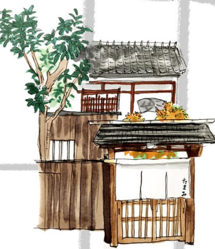
京都鴨川のお宿 たまみ

明治時代建築の町家をリノベーションした 一日一客様の貸切宿。鴨川沿いにある プライベート床が自慢。